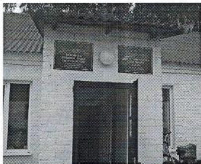
Фото №1- Прилегающая территория