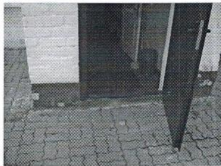
фото №2- вход в здание