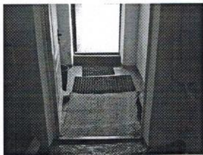
Фото №3- пути движения внутри здания